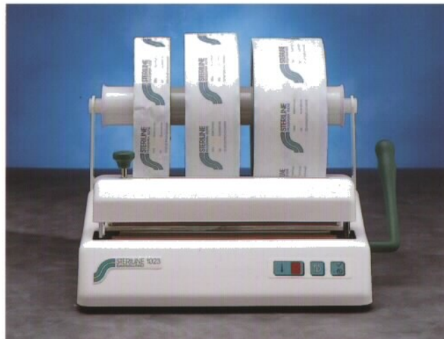
Gerät mit Rollenhalter und Digitalpotentiometer

STERILINE ist ein von dental X eingetragenes Warenzeichen. Änderungen infolge technischer Weiterentwicklung bleibt vorbehalten.