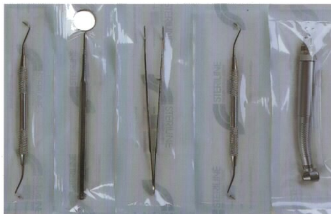
Die Tüten STERILINE sind in verschiedenen Größen vorhanden.